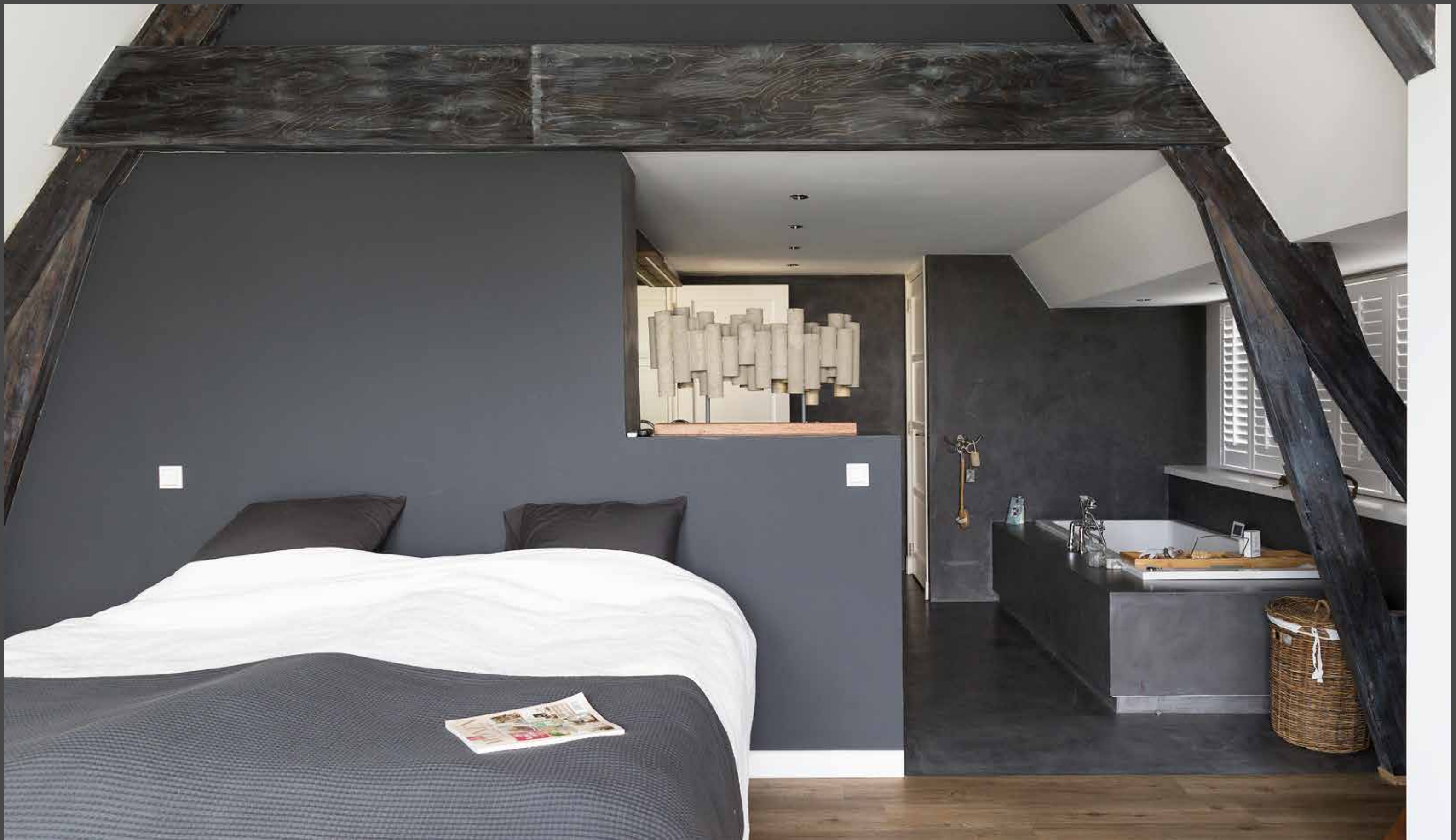
De masterbedroom is ook helemaal door Tim zelf bedacht. Fleur: "Ik heb alle accessoires, de kleuren van de betonlook, de spiegel, kortom alle details bepaald. Hij is samen met de timmerman gaan bouwen. Het werd een open badkamer. Onze slaapkamer heeft een prachtig uitzicht op de Lek."